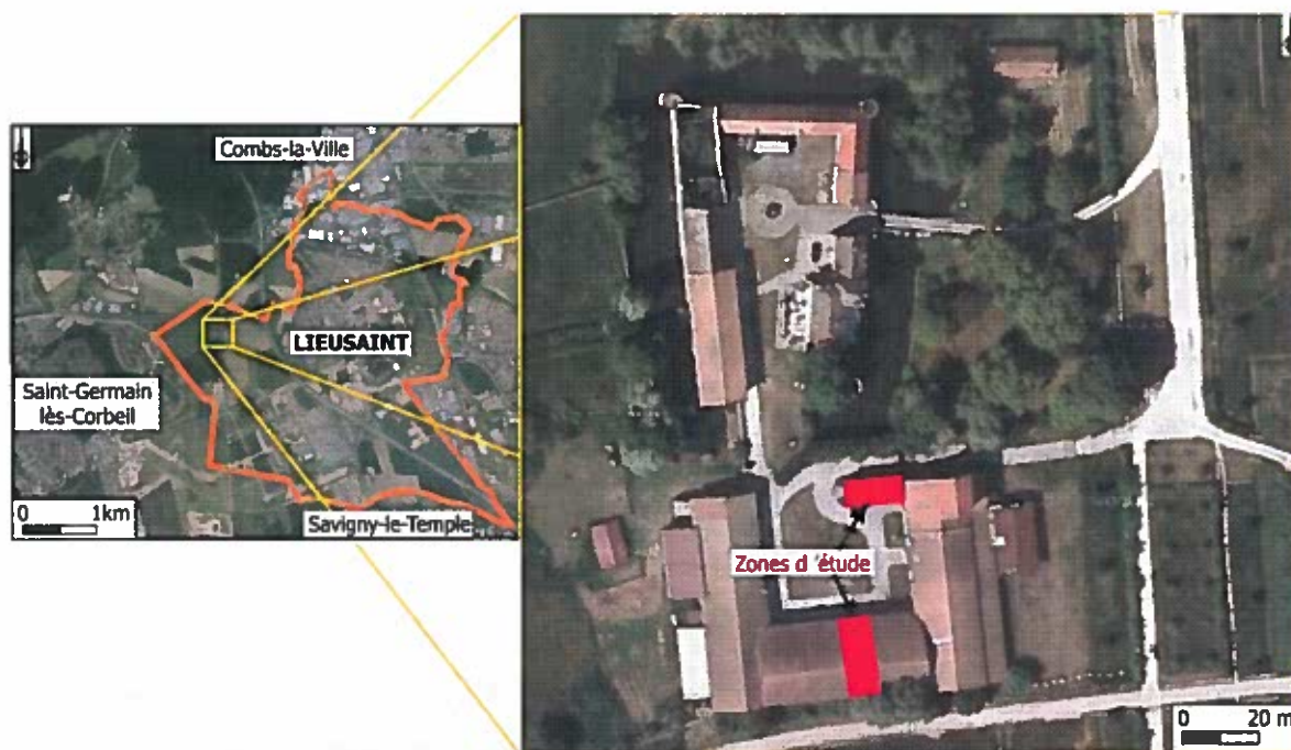
Localisation du site d'étude dans la commune de Lieusaint.

L'emprise du site s'inscrit dans la partie occidentale de la commune, à dominante agricole, composée de parcelles cultivées de grande taille.