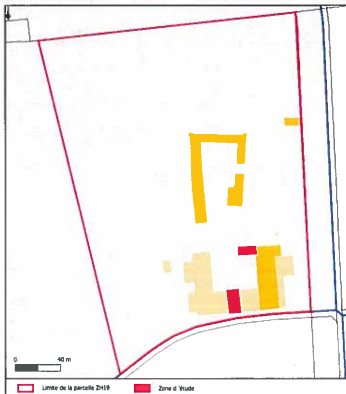
Plan cadastral du site d'étude.

Deux zones ont été soumises à investigation, il s'agirait des deux zones de stockage de produits potentiellement polluants dans l'emprise des anciens bâtiments industriels (Indication du donneur d'ordre). Ces deux zones correspondent donc à une partie de la parcelle ZH19 dont la superficie totale est de 55 452 m 2 . Les deux zones d'étude ont une surface d'environ 300 m 2 .